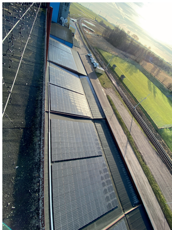
Solcellerna på vårt lagertak.